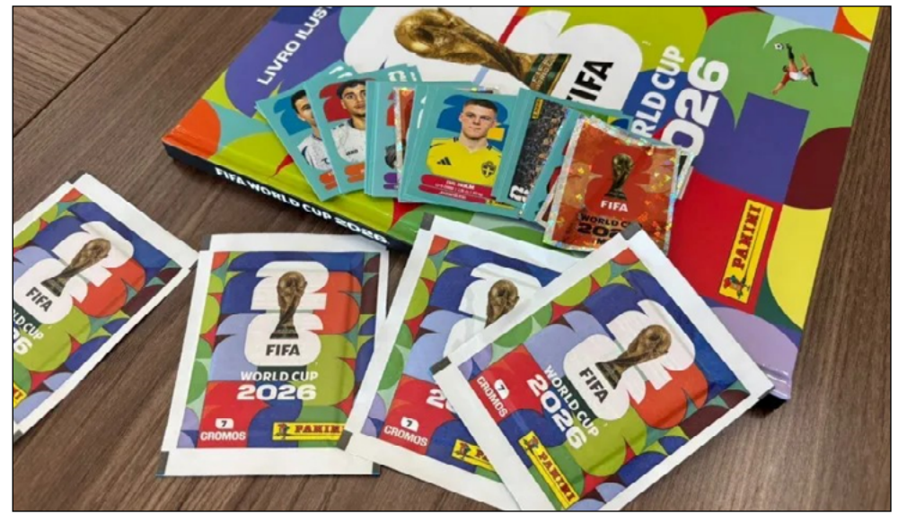
TROCA de figurinhas na Praça da Inconfidência se tornou tradição nas Copas na cidade

Em nota, a Panini anunciou nessa terça-feira (19) que lançará um pacote de atualização para a seleção brasileira. A empresa irá incluir atletas que figuraram na convocação como Neymar, Endrick e Igor Thiago. Além disso, jogadores como o Bento, Estevão e Rodrygo não foram convocados, mas estão no álbum.