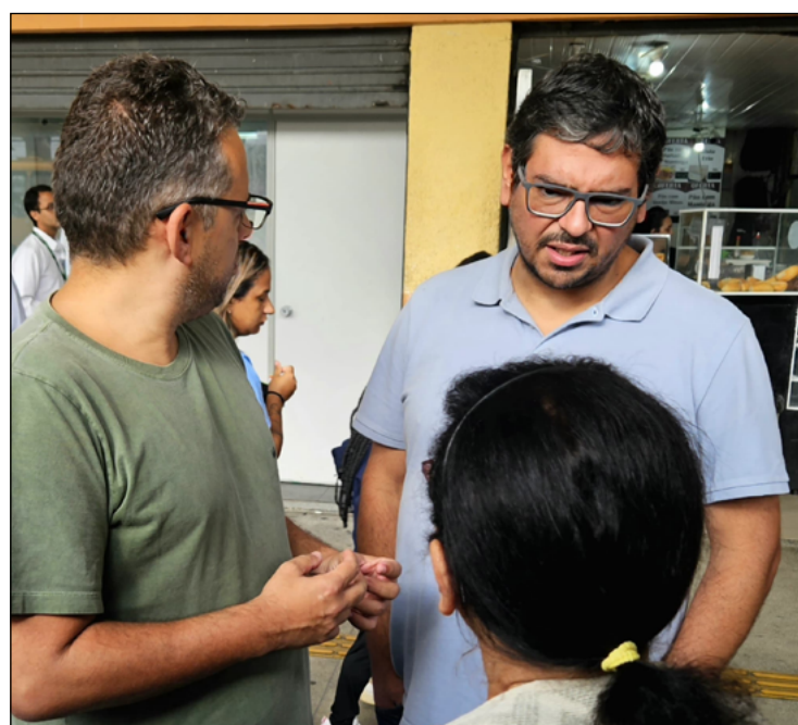
THIAGO acompanhou primeiro dia de mudança no transporte público

A programação completa está no site e no Instagram da Prefeitura (petropolis.rj.gov.br / @petropolis_pmp).