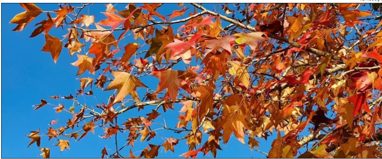
AS PROJEÇÕES para a próxima estação indicam que as chuvas e as temperaturas devem ficar abaixo da média.