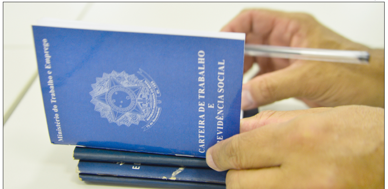
O BALCÃO desta semana também conta com oito vagas destinadas a pessoas com deficiência comprovada

Técnico Eletromecânico - Ensino Médio Cursos especí-