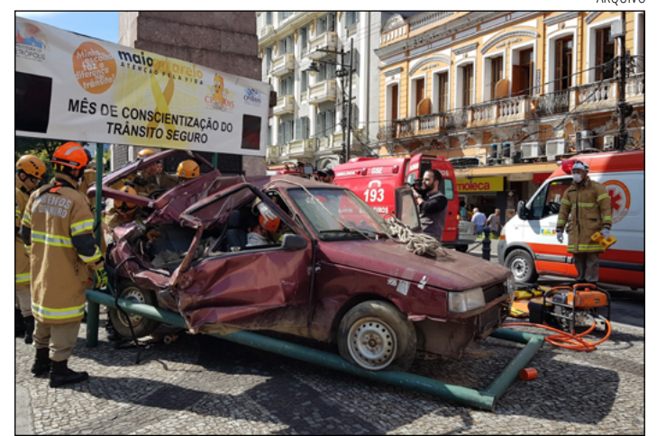
AO LONGO de todo o mês haverá atividades de conscientização

A programação também inclui apresentações culturais de alunos da rede municipal de ensino, como o Coral Canta Gunnar, da Escola Gunnar Vingren, com 45 alunos, que fará uma apresentação especial. Em seguida, estudantes da Escola Municipal Arnaldo Dyckerhoff apresentarão o Rap do Trânsito e uma poesia autoral sobre segurança viária, reunindo 15 alunos em uma performance, que une educação e arte para conscientizar.