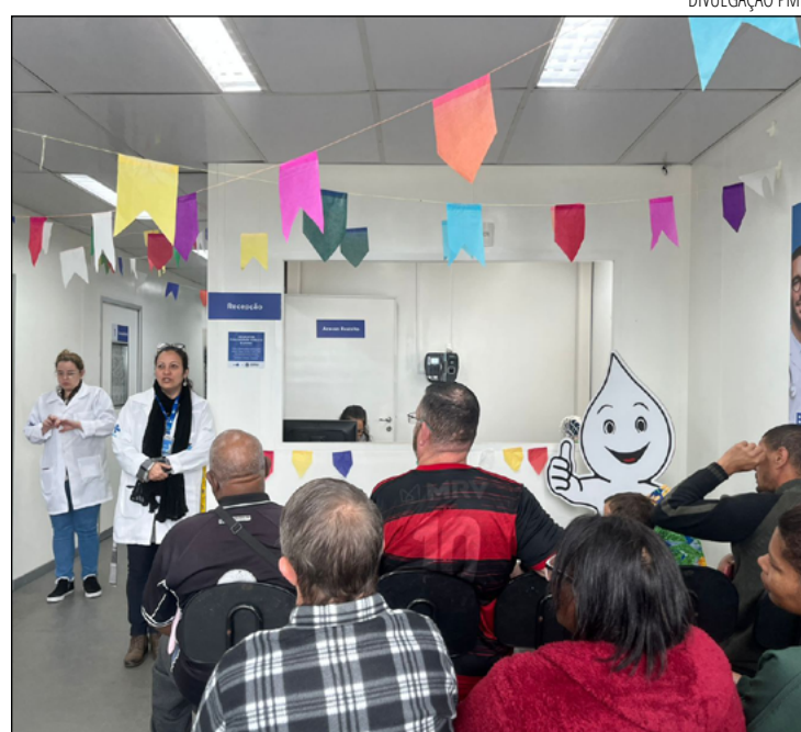
TAMBÉM teve rodas de conversa, avaliação nutricional, e outros

O Dia D foi realizado nos PSFs Vale das Videiras, Meio da Serra, Alto da Serra, Alto Independência e São Sebastião e na UBS Araras, onde houve