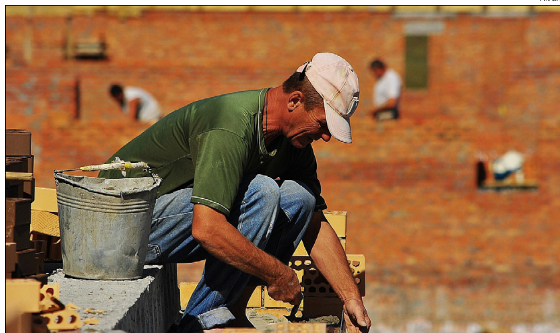
ENTRE AS oportunidades oferecidas esta semana está a de ajudante de obras com 6 vagas

Açougueiro - Ensino Fundamental - 1 vaga Açougueiro - Ensino Fundamental - 2 vagas Ajudante de Depósito - Ensino Fundamental - 3 vagas Ajudante de Obras - Ensino Fundamental - 6 vagas Auxiliar Administrativo - Ensino Médio Experiência de 1 ano na função - 1 vaga Auxiliar de Cozinha - Ensino Fundamental - 3 vagas Auxiliar de Manutenção Predial - Ensino Fundamental Experiência na função - 2 vagas Auxiliar de Produção - Ensino Médio - 2 vagas Auxiliar de Produção - Ensino Médio Experiência na função - 1 vaga Auxiliar de Serviços Gerais - Ensino Fundamental - 3 vagas Assistente Adminis-