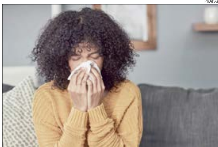
CASOS DE GRIPE quadruplicaram na cidade nos meses de inverno

Um dos principais riscos a saúde causado pelo inverno é a possibilidade de infarto, principalmente nas pessoas mais velhas. Uma pesquisa feita pela revista científica Science of the