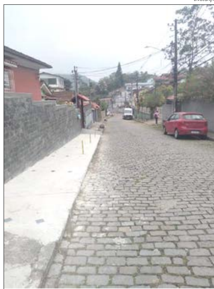
RUA RAUL VEIGA, no Quitandinha, apresenta desnível em um trecho